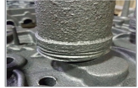
Döküm Parça Görüntüsü