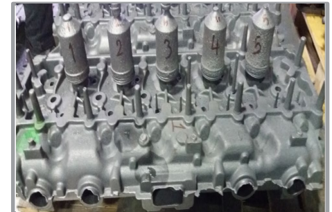
Döküm Parça Görüntüsü